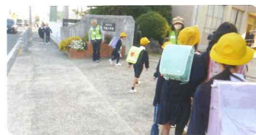
あいさつ運動(円座小学校)