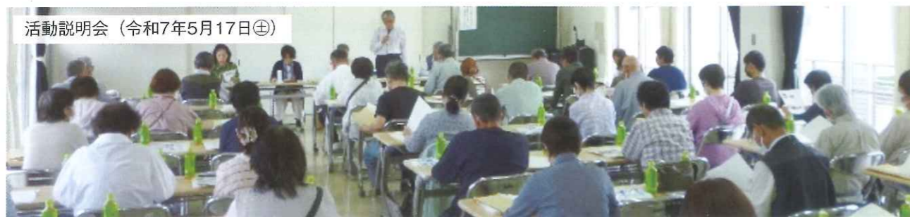
活動説明会(令和7年5月17日⊕)