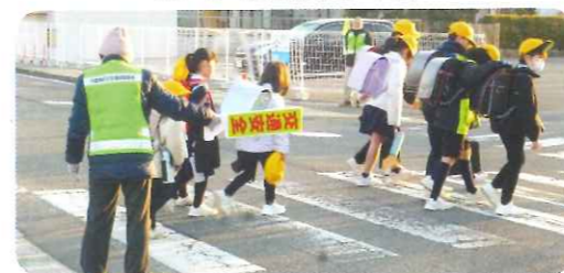
立哨(円座小学校近辺)

立哨は開校日の第1・第3水曜日に、あいさつ運動は年2回行いました。子ども達の安全に気を配りながら見守っています。子ども達の笑顔に元気をもらっています。